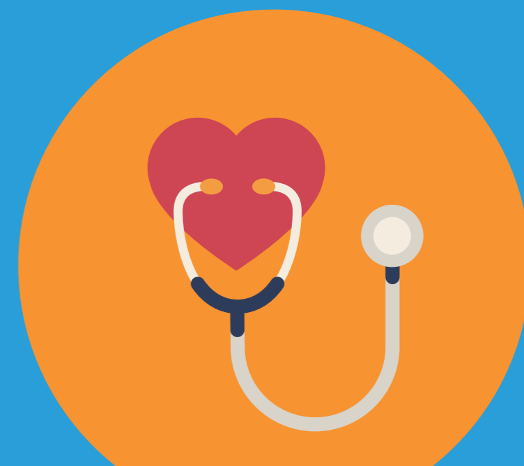
PRESIÓN ARTERIAL ALTA